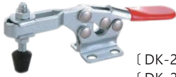
[DK-225-1-1] 不鏽鋼 [DK-225-1-2] 高碳鋼