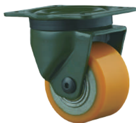
[ JZ-618-1S ]