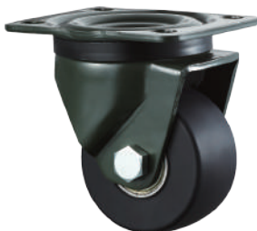
[ JZ-618-2S ]

Japanese and European bracket MC nylon wheel