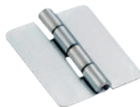
[ OH-302-2-2 ]