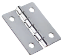
[ OH-302-1-1 ] [ OH-302-2-1 ]