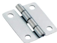
[ OH-302-2-3 ]